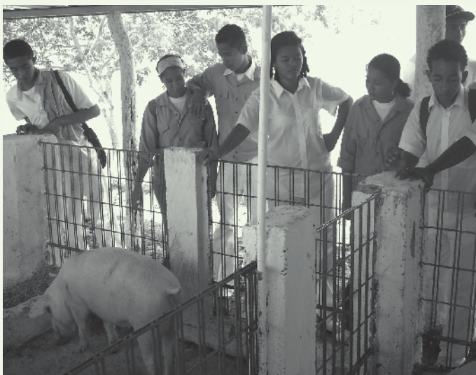
Concreet leerproces voor toekomstige zaakvoerders

Voorheen had Colombia een in hoofdzaak landelijk karakter met nogal harde levensomstandigheden. Vandaag woont 75% van de bevolking in stedelijke gebieden, maar het lot van de boeren is er zeker niet op verbeterd, integendeel. Het Colombiaanse conflict geeft aanleiding tot een bloedige strijd om grond. De inheemse onzekerheid veroorzaakt een massale verplaatsing van landbouwers die vaak uitmondt in de miserie van de sloppenwijken.