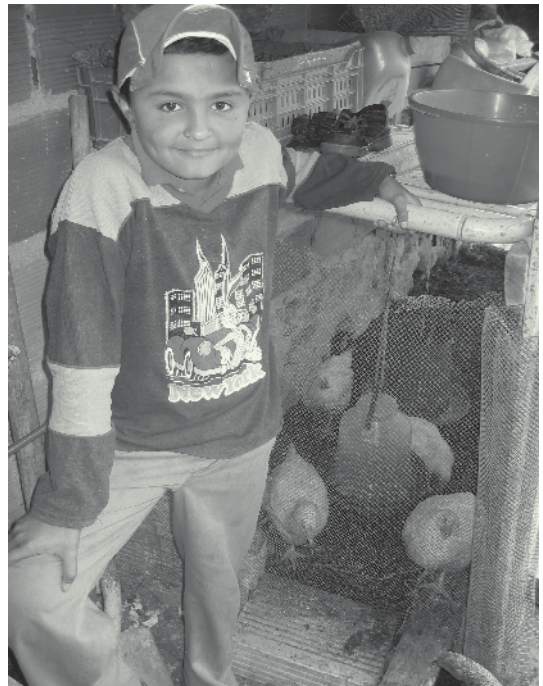
Een leerling en zijn productief project